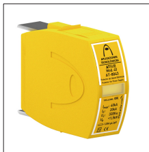
AT-8045 ATSUB Mod. 65-300