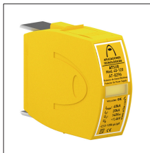
AT-8298 ATSUB Mod. 65-120